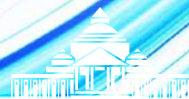
TAVOLA ROTONDA 12:00-13:30